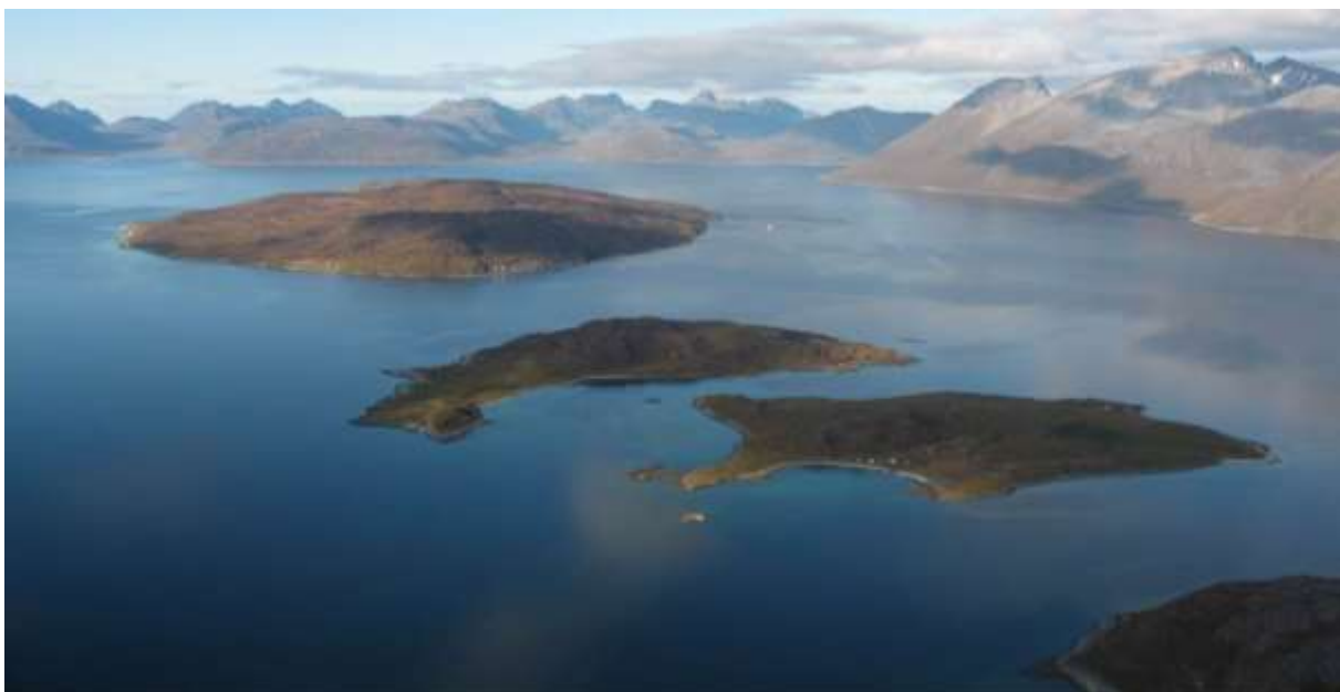
Arnøya bakerst, Kågen oppe til høyre, Vorterøy, Follesøya Store og Lille og litt av Uløya nederst til høyre. På østersida av Vorterøya ser en oppdrettsanlegget Kåvika til Lerøy Aurora AS.

For akvakulturnæringa er sjøareal en viktig produksjonsfaktor. Nord-Troms har gode forhold for produksjon av laks. Tilgang på nye og gode lokaliteter er en forutsetning for videre utvikling av næringen. Ny kunnskap, ny teknologi kombinert med nye krav til sykdoms-bekjempelse gjør at en nå ønsker å ta i bruk nye og mer vær eksponerte lokaliteter. Innen havbruk er det seks tillatelser for laks og ørret, samt en for blåskjell i Nordreisa kommune. Til sammen er det rundt 15 årsverk direkte knyttet til lakseoppdrett. Havbruksnæringen gir også sysselsetting i kommunene på leverandørsiden, spesielt transport (med ca. 50 årsverk). I Skjervøy kommune er det i dag åtte tillatelser for laks og ørret, samt to slakterier. Det er til sammen rundt 20 årsverk direkte knyttet til lakseoppdrett. Havbruksnæringen fører også til sysselsetting i kommunen på avledet virksomhet, spesielt slakterivirksomhet med ca. 100-110 årsverk.