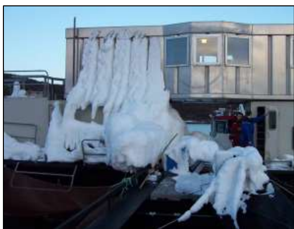
Nedising av oppdrettsflåte under Narve januar 2006

I januar 2013 gikk det et snøskred som var svært nært til å ødelegge merdene på oppdretts-lokaliteten Uløy i Rotsund. 2 lokaliteter vurdert av NGI. I tillegg ligger lokalitet A 17, Kjempebakken, i denne skredsonen.