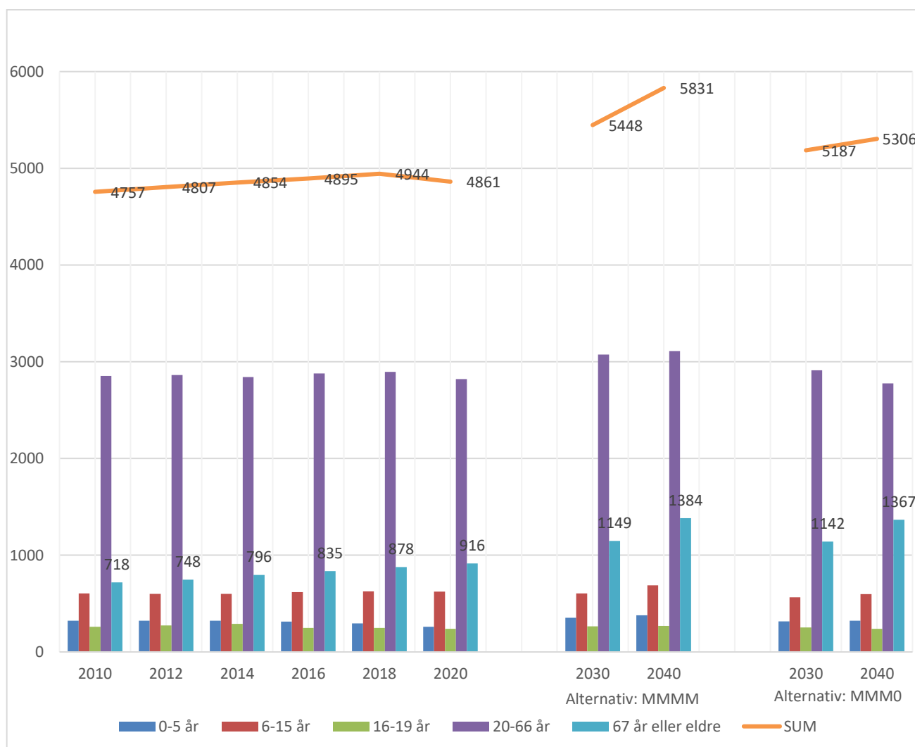
Figur 1 Befolkningsutvikling 2010-2020 og framskriving til 2030 og 2040 med 2 ulike alternativer (MMMM = ingen nettoinnvandring). Kilde SSB

Som man ser av figur 1 under, vil utviklingen av antallet eldre over 67 år være nokså uavhengig av framskrivningsmodell av befolkningstallet. Derimot vil prosentandelen eldre øke ganske kraftig, jf. figur 2 under.