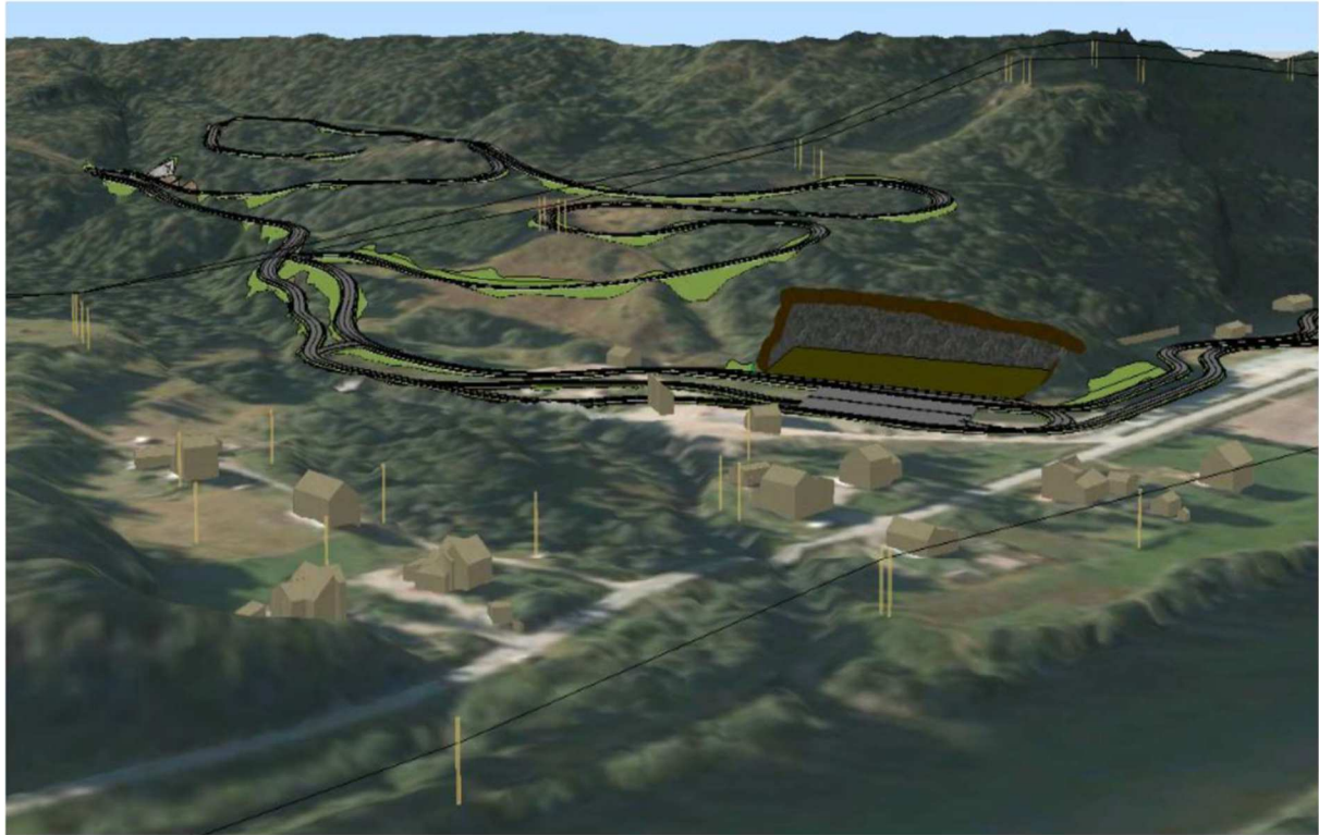
Fig.3. Område Saga i 3D. Tiltente masseuttak markert ved bakkeskråning.