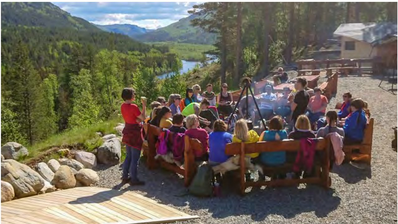
Arrangement på Ovi Raishiin – Visitor Point Reise nasjonalpark.

Bred verdiskaping – Hva er det, og hva betyr det for oss?